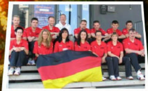
U 18-WM in Kosice: 2 x Bronzemedallengewinner Deutschland