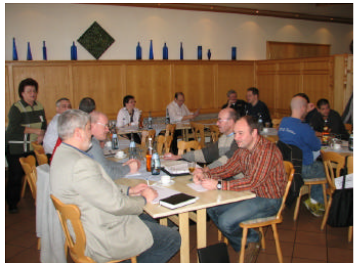
Jahresversammlung der DKBC-Jugend 2007 in Viernheim.