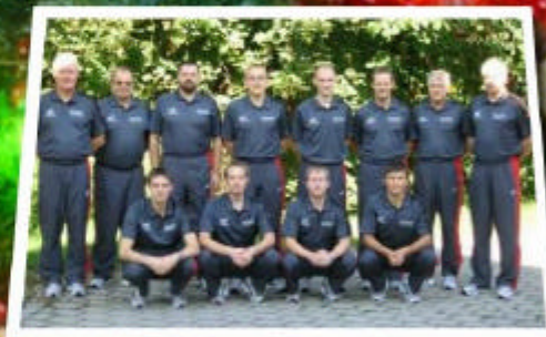
Rot-Weiß Zerbst: Deutscher Meister 2007 Welpokalsieger 2007