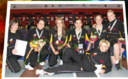
U 18-WM in Kosice: Weltmeister Deutschland

Frohe Weihnachten und ein erfolgreiches Jahr 2008